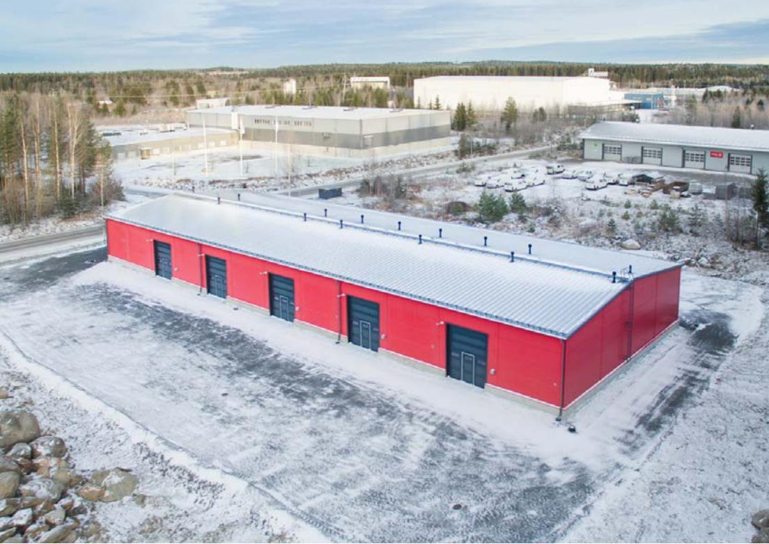
Toimistotilat lattiakerroksessa tai toimistoparvi.